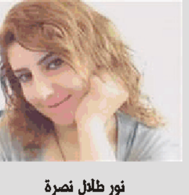
نور ظلال نصرة

اهتمامي بك يجعلني أنثى أخرى أنثى من نوع آخر شرقية .. لا عصرية لم تكن لتباني يوماً بحديث أمها أو جدتها عن الحبل السري بين القلب والمعدة ولم تلجا حينها إلى وصفات الحب الأبروسية *** أعد الطعام بشبهية أكثر أخذ المطبخ لأول مرة هناك ساكنين كثيراً .. لم أعد عليها بعد أعدت نصلاً بخفة .. أتساعل طبيب نية هل لجرحها ذات الأمل .. ألمك إن شرد ذهني بعيداً أم ترائي سأبتلع نصل السكين على الحدين سواء