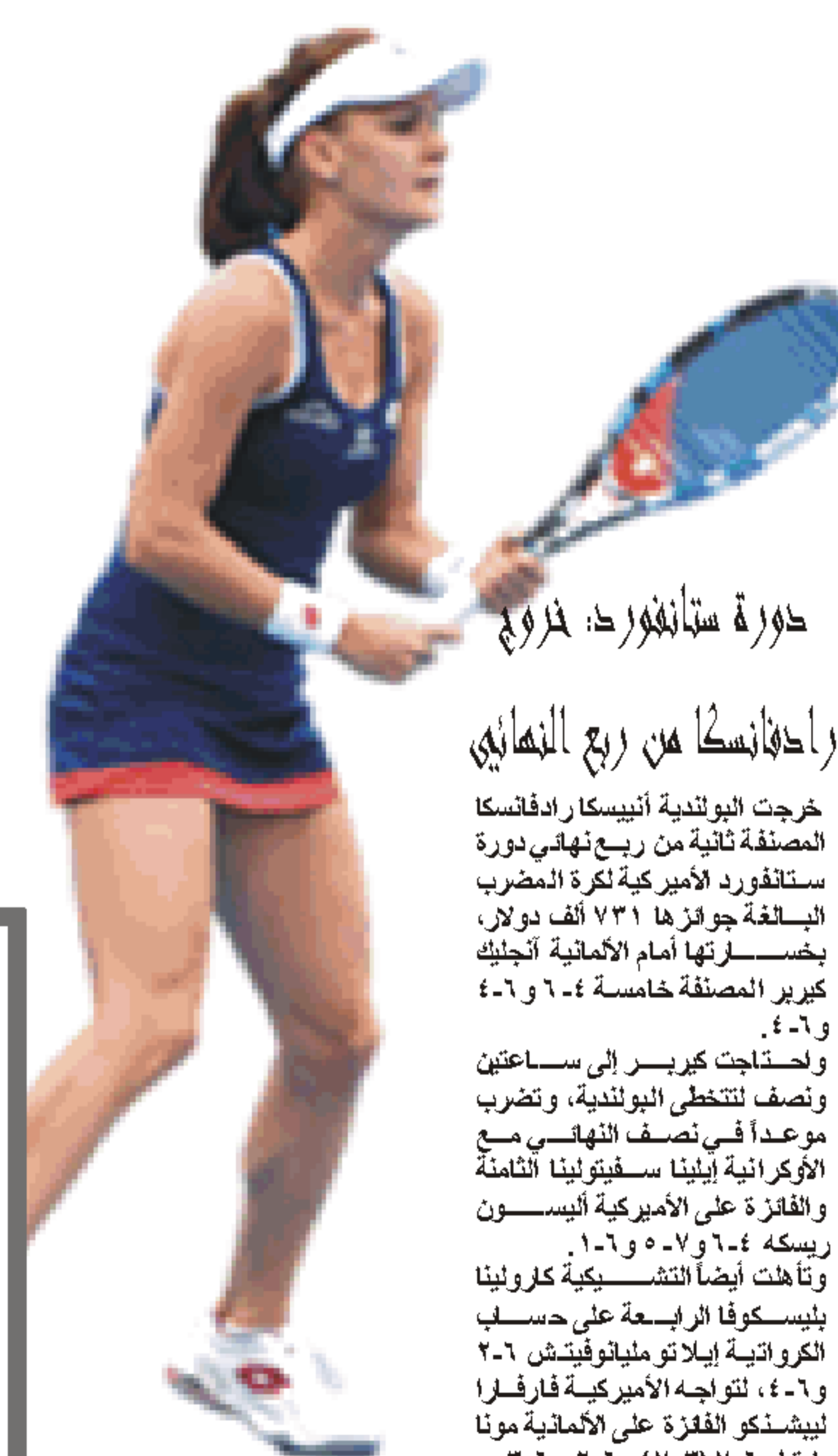
حورة ستامفورد: لزوم