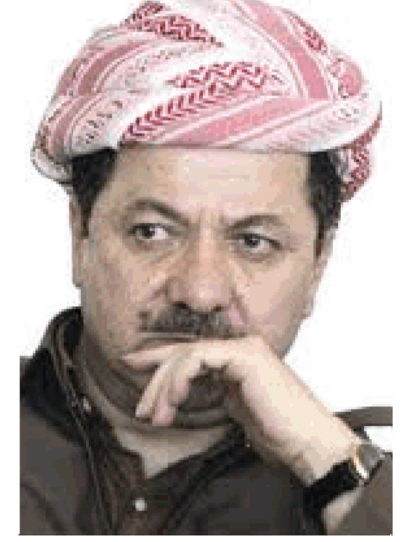
العراق اليوم، خاص