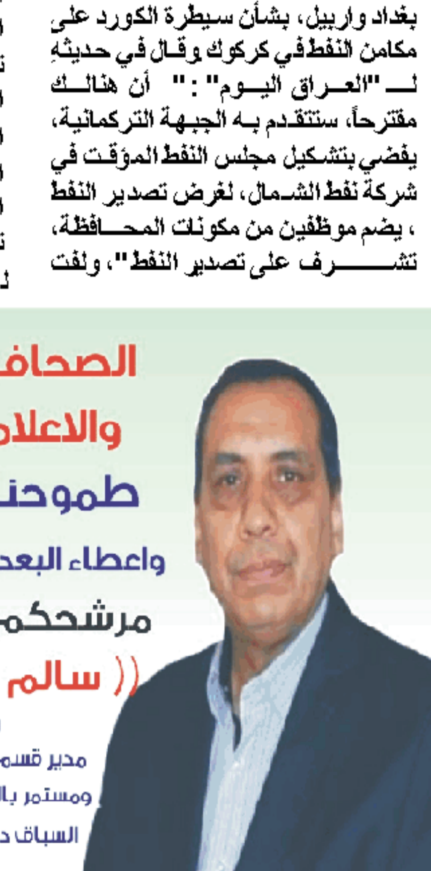
العراق اليوم، خاص

الصالحى الى مخاوف تتناب المكون التركماني مما يحصل: "أن المكون التركماني، يخشى من أن يتم ربط الانبوب الأخر الذي سينتهي العمل منه قريباً، والذي يمتد من كركوك عبر اربيل الى ميناء جيهان، عندها ستجرد الحكومة المركزية من أية صلاحيات، لإدارة النفط في كركوك"، ويشن جلسة البرلمان التي من المقرر ان تعقد، استبعد الصالحى قيامها: "أن يتم عقد الجلسة بسبب عدم التوافق على مرشحي الرئاسات الثلاث"، وكان رئيس السن لمجلس النواب مهدي الحماص أكد في وقت سابق "أنه لم يتسلم أسماء المرشحين للرئاسات الثلاث المزمع التصويت عليهم لحد الآن، ثم أعلن أنه تسلم اسم سليم الجبوري، من اتحاد القوى الوطنية، كمرشح لرئاسة البرلمان، وقام برفع جلسة الأحد الماضي، الـ ١٣ من تموز لجري الى اليوم الثلاثاء، كي يتم الحصول على توافق بخصوص اسماء المرشحين، لرئاسة الجمهورية ورئاسة الوزراء.